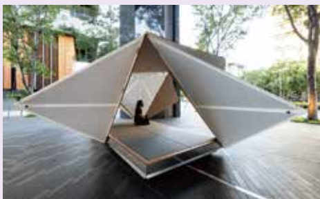
《場域·啟發—隈研吾展》全新戶外裝置「摺箱」

《場域·啟發—隈研吾展》在忠泰美術館本館旁的「明日聚落」一樓空間展出中，展期至9月12日止，為線上預約，免費參觀；美術館本館現正展出的《聚變：AA倫敦建築聯盟的前銳時代》，因應疫情延展至12月5日止，同樣也啟動線上預約制參觀，兩檔展覽的場館步行距離約三分鐘。更多預約參觀訊息，詳見忠泰美術館官網。