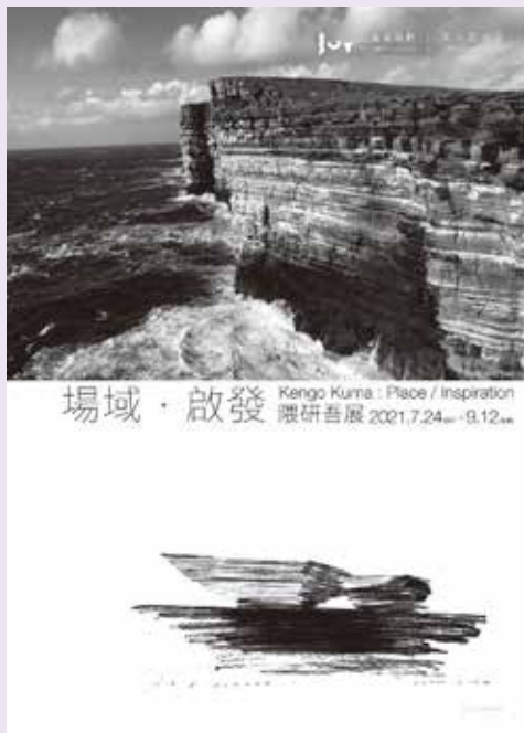
忠泰美術館2021奧夫塞計畫 《場域·啟發—隈研吾展》主視覺

忠泰美術館於7月24日迎來五週年計畫第二檔展覽—2021奧夫塞計畫《場域·啟發—隈研吾展》。「奧夫塞計畫（Off-Site Project）」作為忠泰美術館跳脫既定展演場域框架的長期實驗項目，「Off」意味著離開既定場域，奔赴非典型環境，從制度中解放，藉此獲得自由創新之實驗可能。今年特別邀請到享譽國際的日本建築師隈研吾（Kengo Kuma），一起走出美術館，踏入周