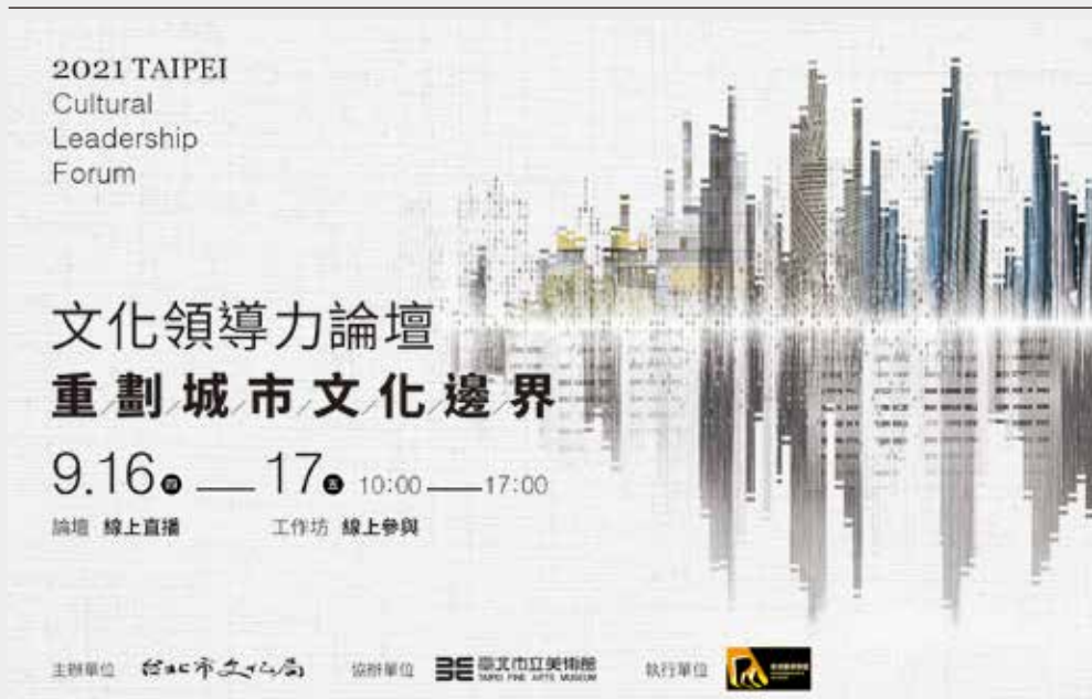
《文化領導力論壇》主視覺