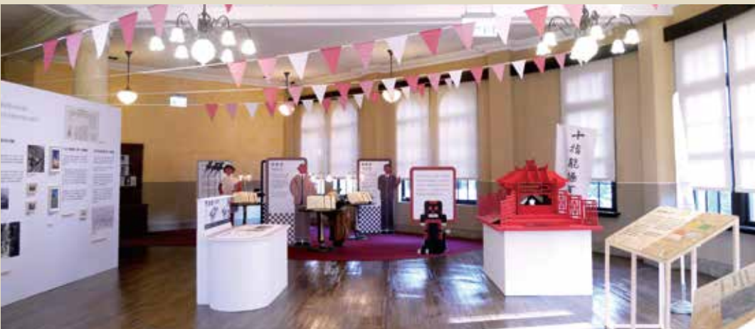
特展《趣吧！與百年前的興趣相遇》展間主空間。

今年以文協百年為主題的活動相當豐富，臺灣新文化運動紀念館推出《趣吧！與百年前的趣味相遇》特展，透過1920年代現代化帶來公共空間與時間觀念的改變，新時代的興趣概念也應運而生，而總督府與文協青年們也在各種休閒娛樂的場域爭奪話語權、進行角力，由不同的面向來認識文協，並以此揭開新文化運動月之序幕。