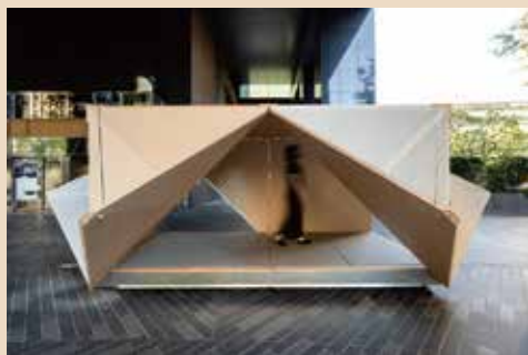
《場域·啟發—隈研吾展》全新戶外裝置「摺箱」

本次在忠泰美術館展覽，展出隈研吾近年精選作品，包含六件文化性設施之博物館、美術館或文學館與十一件實驗性裝置模型、書籍，以及隈研吾於創作時與場所「溝通對話」的靈感牆；此外，隈研吾特別為本展創作了一件全新戶外裝置「摺箱（Oribako）」，讓日本傳統文化與臺灣場域對話交流。本文及展覽試圖從地景塑造的當代藝術邏輯，去探索「空間美學」的文化能量與我們的城市與環境的對話，共同探索場域、建築的無限可能性。