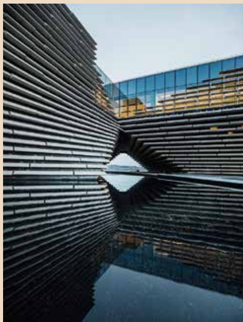
V_A博物館丹地分館

隈研吾認為，建築不應該成為融和性環境成長歷程的障礙，而是連結人與環境的橋樑。「V&A博物館丹地分館（維多利亞和艾伯特博物館丹地分館）」是蘇格蘭首座博物館，鄰泰河（River Tay）水岸，隈研吾取法奧克尼群島海岸景觀，使用碎石骨料、紋理粗獷的預鑄混凝土板變換不同角度水平疊放，形成有豐富陰影及變化的「懸崖」，鏤空建築中央，重新連接起街道與水岸、都市、與自然。菲律賓之新石器時代文化遺產所設計的「祖先的智慧博物館」，連結當地地貌景觀與史前時代洞窟居所的空間文化記憶轉譯為建築，孕育出與當地的文化融合為一的空間地景。這樣的概念是一種東方文化中的「境象轉化（mindscape representation）」，謙卑地將人造物與大地融合，如同柳宗元在《始得西山宴遊記》中登頂不言「征服」，而識得人之卑微應與大地化合為一渾然而為一體。