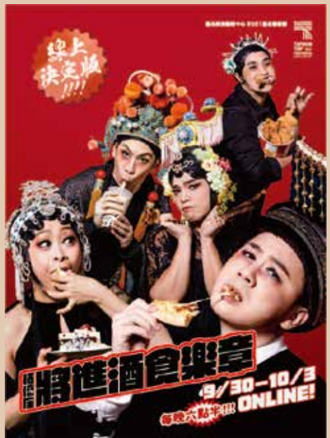
《將進酒食樂章—線上決定版》

自我，享受獨處的撫慰時光。10月1日至10月31日邀請與品文共同完成一場專屬你和她的獨立展演。