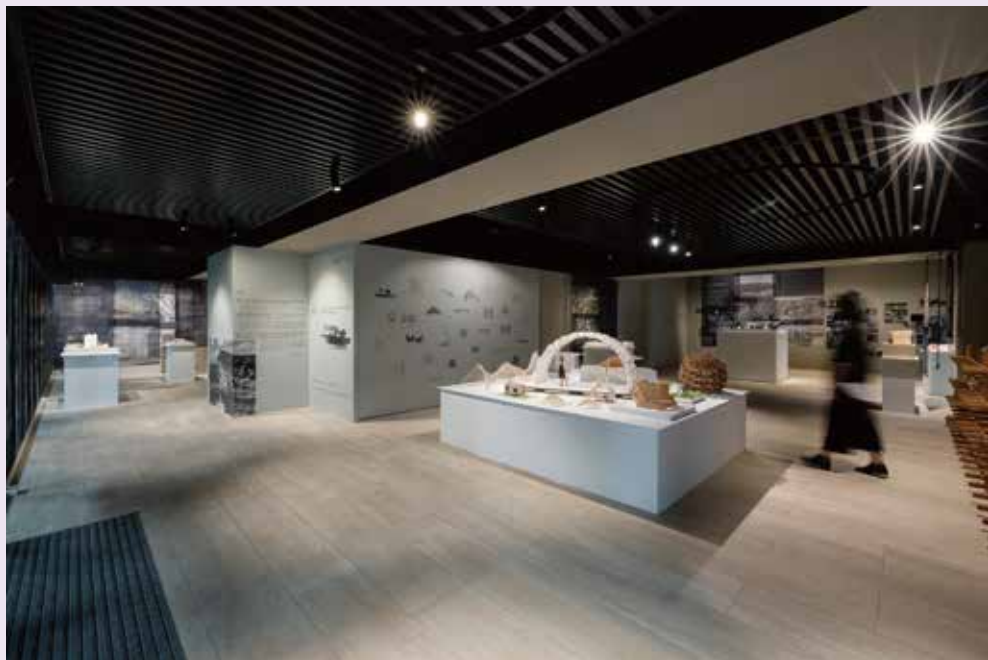
《場域·啟發—隈研吾展》展出六件文化機構建築作品，與十一件充滿實驗性的裝置模型、書籍 ©忠泰美術館

這次臺灣個展，隈研吾還特地創作一件全新戶外裝置作品「摺箱 (Oribako)」，靈感取材自日本茶文化中的移動茶室，結構設計汲取日本傳統摺紙文化，打造這座承繼日本傳統建築概念的靜謐茶室，而隈研吾也期盼，能將「摺箱」延伸化作人際溝通的庇護之所，提供人們紛擾時代中的一方淨土。