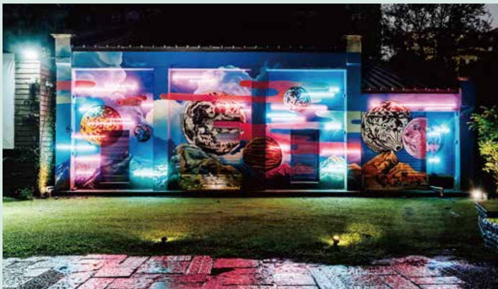
2019年原創基地節《幻場》，藝術家藍色隧道作品〈無限Rebirth〉。