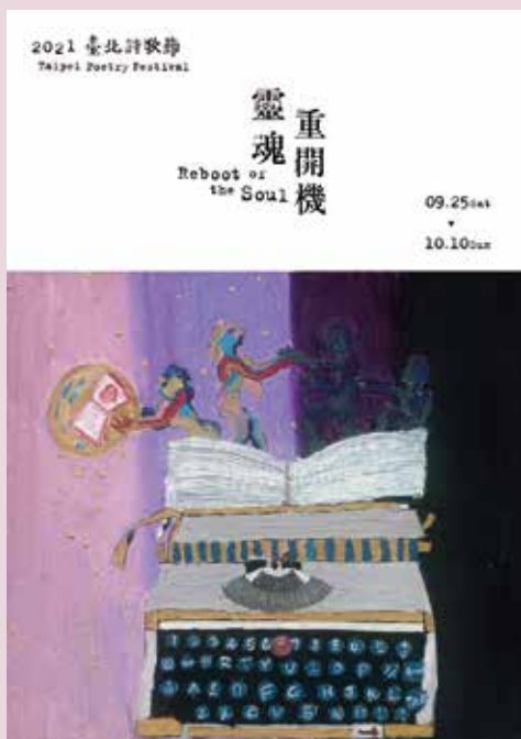
2021臺北詩歌節《靈魂重開機》主視覺。設計：崔舜華

由臺北市政府文化局主辦的臺北詩歌節，在今年因疫情世界彷彿按下暫停鍵之際，策展人鴻鴻及楊佳嫻以「靈魂重開機」為題，邀請詩人與藝術家，以詩歌解封我們的精神生活。活動從9月底起跑，在中山堂、紀州庵文學森林、誠品書店松菸店、光點臺北、市長官邸藝文沙龍等地舉辦，也將