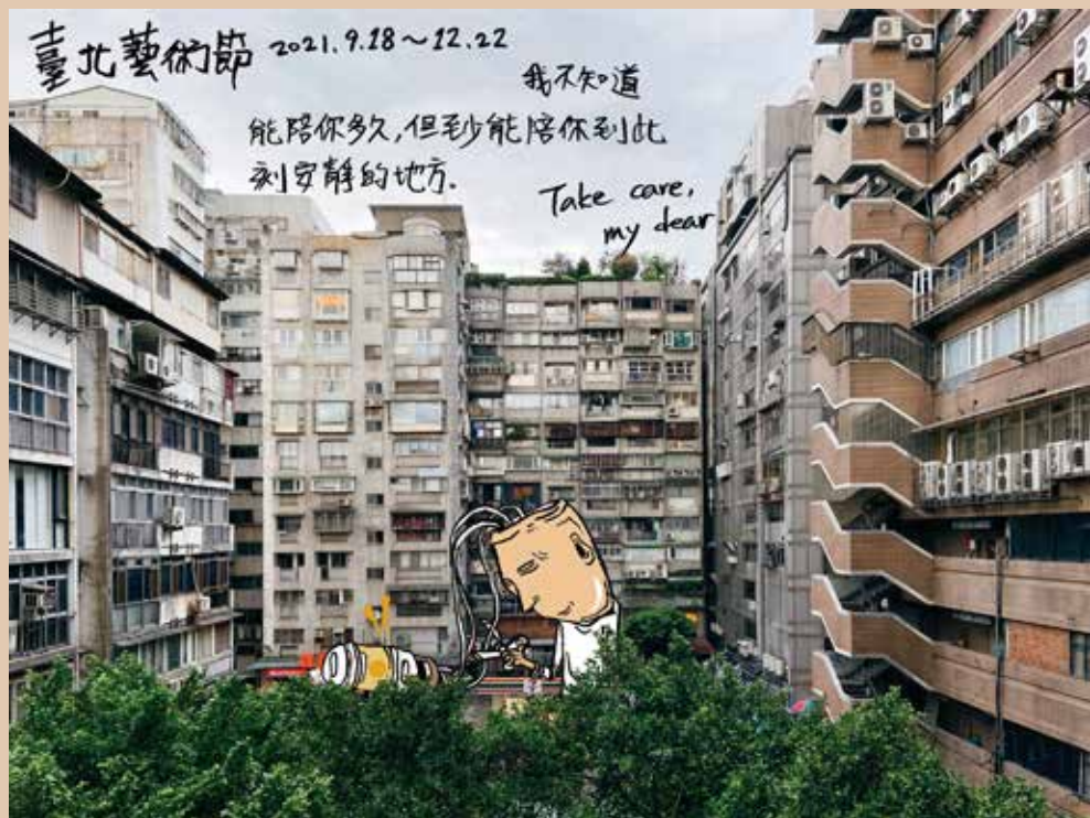
2021 臺北藝術節主視覺

這世界自去年經歷著侵擾全人類生命的全球性創傷，臺北藝術節也不例外的一波受到衝擊，但臺北藝術節不因疫情而停下腳步，仍積極發展線上演出更多的可能性，試圖透過網路穿越時間與空間，帶給觀眾現場演出時的共感體驗。