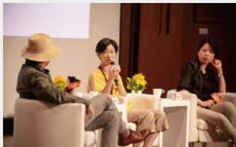
2020文化領導力論壇活動紀錄